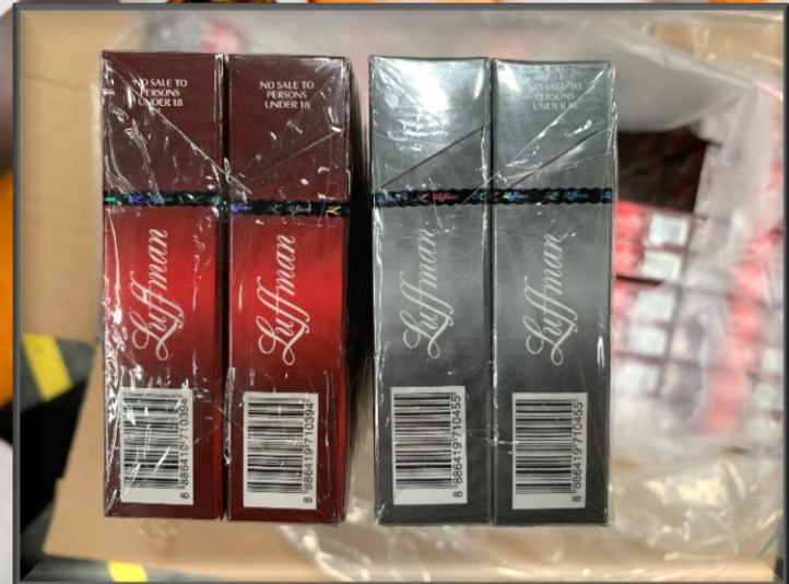
ประมวลภาพการจับกุม ณ บริเวณคลังสินค้าทัณฑ์บนทั่วไปของบริษัท ดีเอแซด ๑๙๕๖ จำกัด