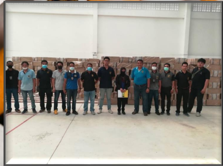
ประมวลภาพการจับกุม ณ บริเวณคลังสินค้าทัณฑ์บนทั่วไปของบริษัท ดีเอแซด ๑๙๕๖ จำกัด